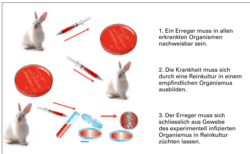
Abbildung 1: Die Koch'schen Postulate.

Gewiss ist Salz ein Kulturprodukt – in römischen Zeiten war die Meersalzgewinnung eine wichtige Industrie. Salz hatte einen hohen Wert: Die römischen Legionäre erhielten eine Zuteilung von Salz als Teil ihres Soldes, das so genannte «salarium» (von lateinisch «sal» für Salz). Daraus wurde später das «Salär» als Besoldung der Offiziere, und noch heute ist der Ausdruck für Gehalt oder Lohn in Gebrauch. Und seither streuen wir Salz in die Suppe und alles, was wir sonst noch zu uns nehmen. Wie schädlich ist nun das Salzen? Wenn man den Vertretern der Salz-Hypothese – und selbst das Schweizerische Bundesamt für Gesundheit gehört dazu – glaubt, so ist Salz für hohen Blutdruck, Hirnschlag und Tod verantwortlich. Neuere Analysen grosser Register legen dagegen nahe, dass zu wenig ge-